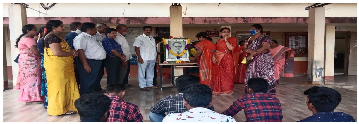
Tribute to Ambedkar